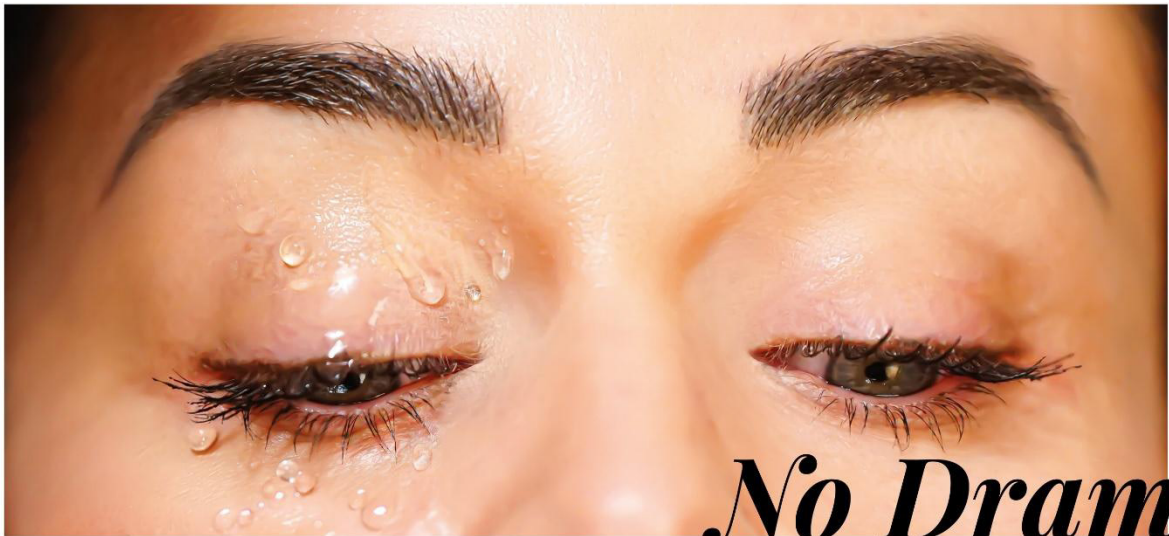
No Drama WATERPROOF MASCARA