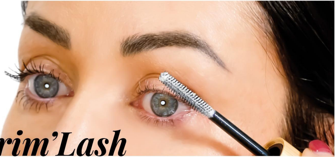
Prim'Lash MASCARA PRIMER